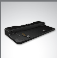
Acoplamiento para escritorio